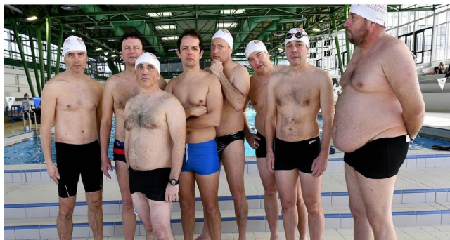
À ses papas nageurs, devant le bassin de la piscine des Glorieuses, à Nantes. Une pose identique à celle de l'affiche du film « Le grand bain », de Gilles Lelouch.

VIDÉO. À Nantes, les papas de nageuses se jettent dans « Le grand bain »